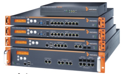
Astaro Hardware Appliances